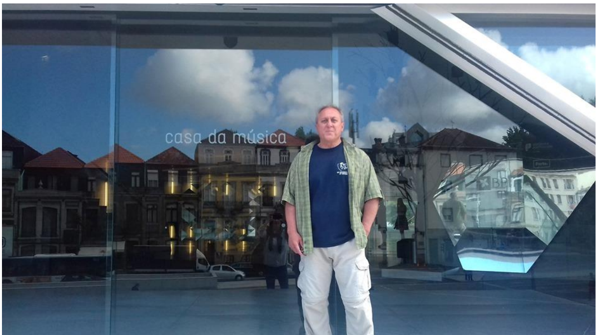
Fotó: Casa da Musica koncert terem

Mivel a kurzus helyszíne Hotel Ibis is az egyik metrómegálló közelében található, nem volt gond a továbbképzésre való napi utazással. Tartva attól, hogy a hét folyamán nem lesz sok időm a városnézésre (hogy igazam volt, az mindjárt a kurzus első napján be is igazolódott), a