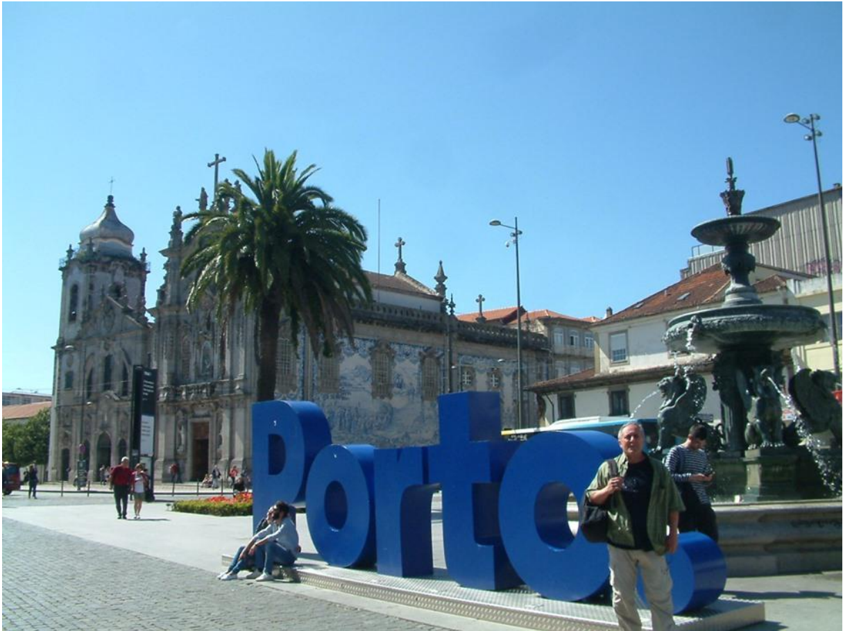
Fotó: Igreja do Carmo, rokokó stílusban épült templom

vasárnapi nap folyamán a várossal ismerkedtem, felkerestem pár helyszínt, amit még otthon néztem ki magamnak.