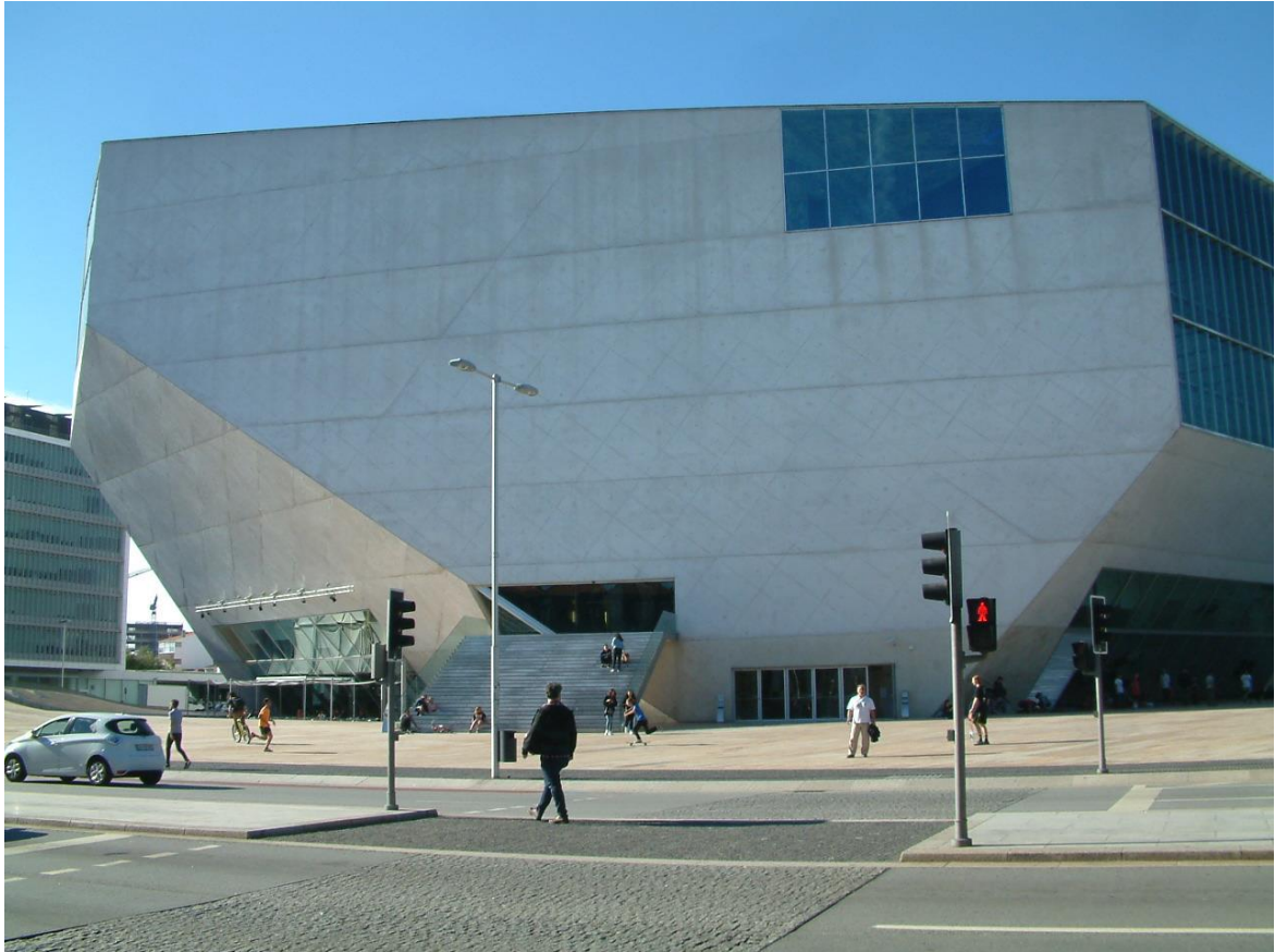
Fotó: Casa da Musica koncert terem