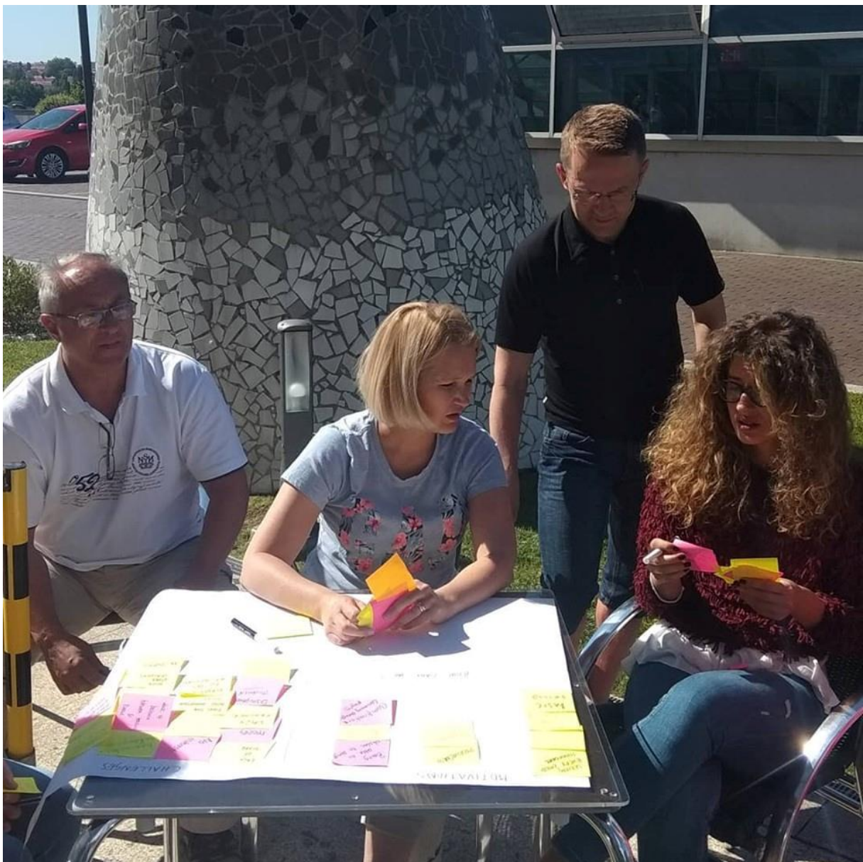
Fotó: csoportmunka a Finn és Spanyol kollégákkal

A kurzus folyamán feldolgozott témák nem voltak ismeretlenek számomra, mivel már hosszú évek óta tanulmányozom a tehetség gondozás problematikáját, viszont most más szemszögből, új stratégia alkalmazásának folyamatában figyelhettem meg a már ismert technikák lehetőségeit. Pontosabban, a csoportmunkában végzett projekt megvalósítás során való azonosítás lehetőségei voltak a képzés fókuszában.