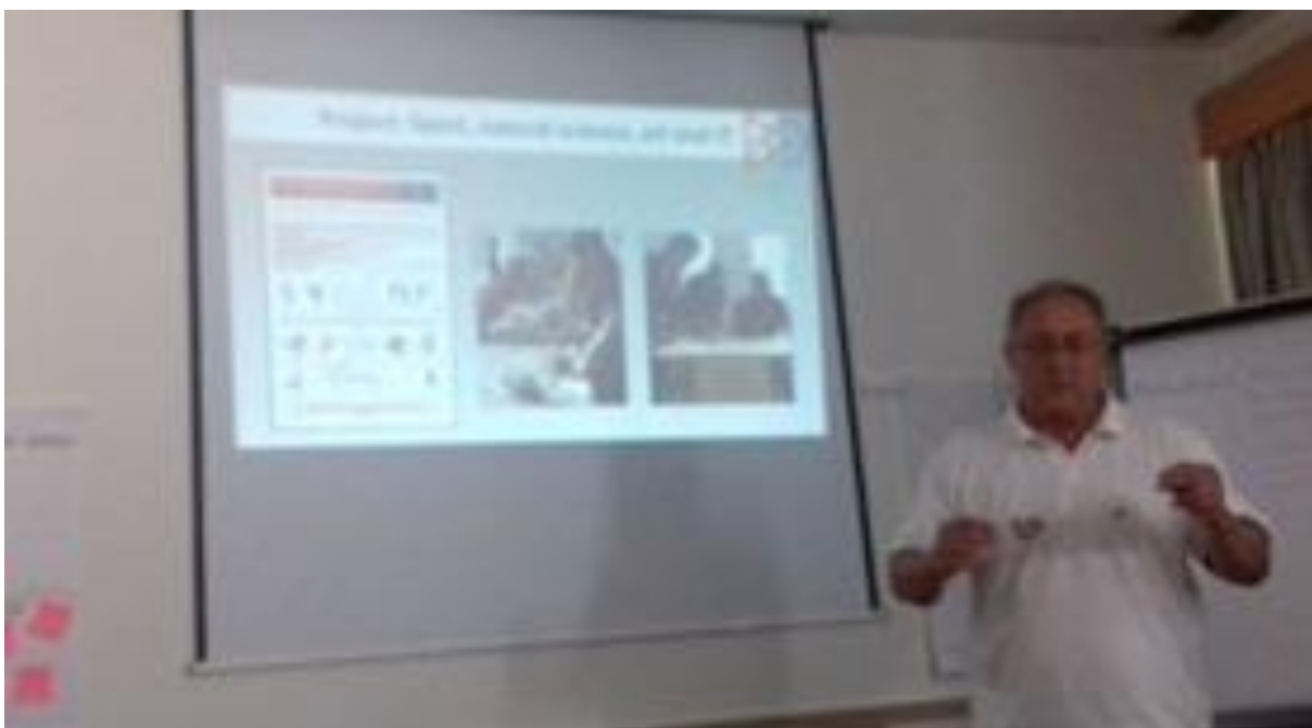
Fotó: Iskolám és a tehetséggondozó programom bemutatása

Több szempontból is hasznosnak bizonyult, hogy részt vettem ezen a kurzuson: