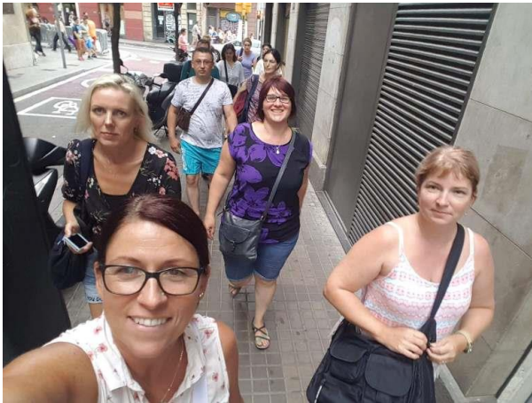
A csoport kirándul a városba